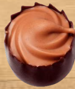
Crème aux noisettes