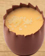
Ganache à la mangue